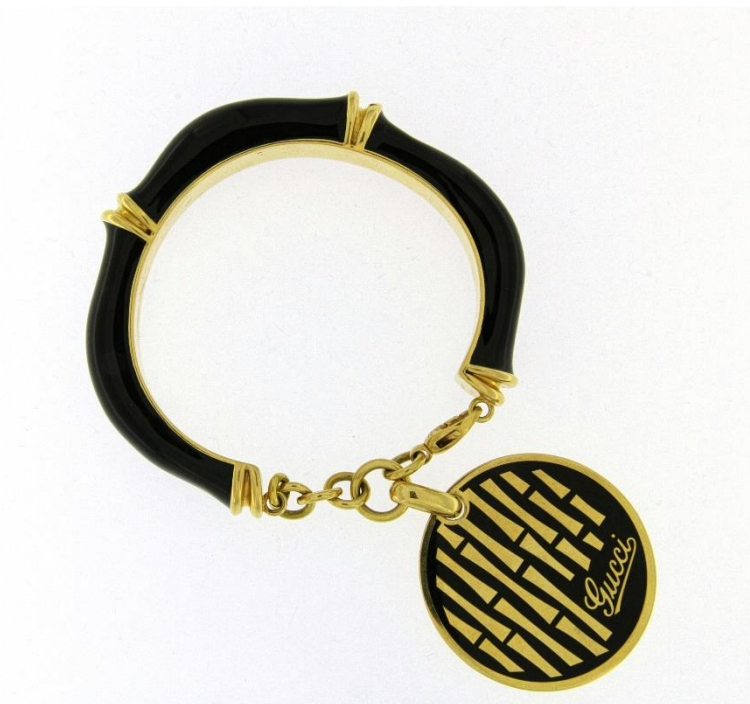
18k yellow gold and black enamel bracelet with charm by Gucci

Bracelet en or jaune 18 carats et émail noir par Gucci