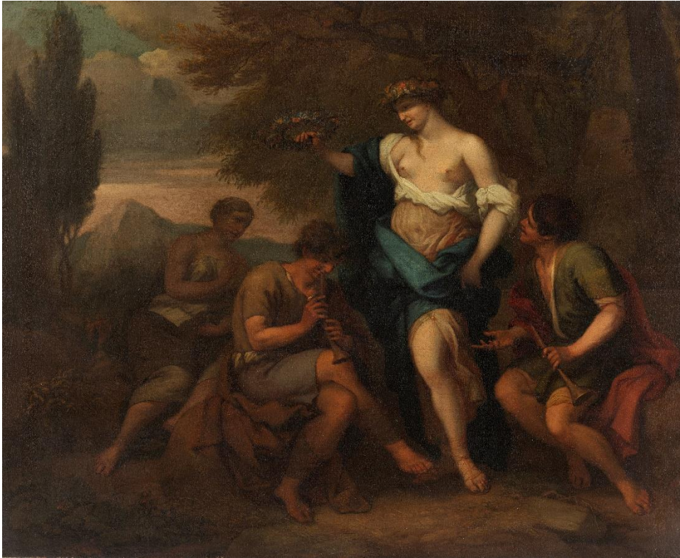
Nicolas Poussin (1594-1665) – Huile sur toile - L. 74,3cm x H. 60,2cm